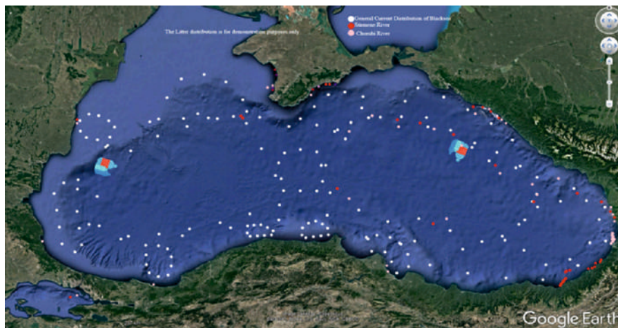
Фигура 2: Сценарии за движението на отпадъци в целия Черноморски басейн (из доклада на проекта LitOUTer)

Физическите характеристики на Черно море, като полузатворен басейн, силна стратификация, силен ръб и антициклонални течения, могат да повлияят на поведението на движението на отпадъците в целия басейн на Черно море (Фигура 1). Възможно е отпадъците да не потъват лесно и да не се изхвърлят от целия басейн. Основните източници на морските отпадъци са от сушата, речните басейни и, разбира се, от морските дейности (Фигура 2).